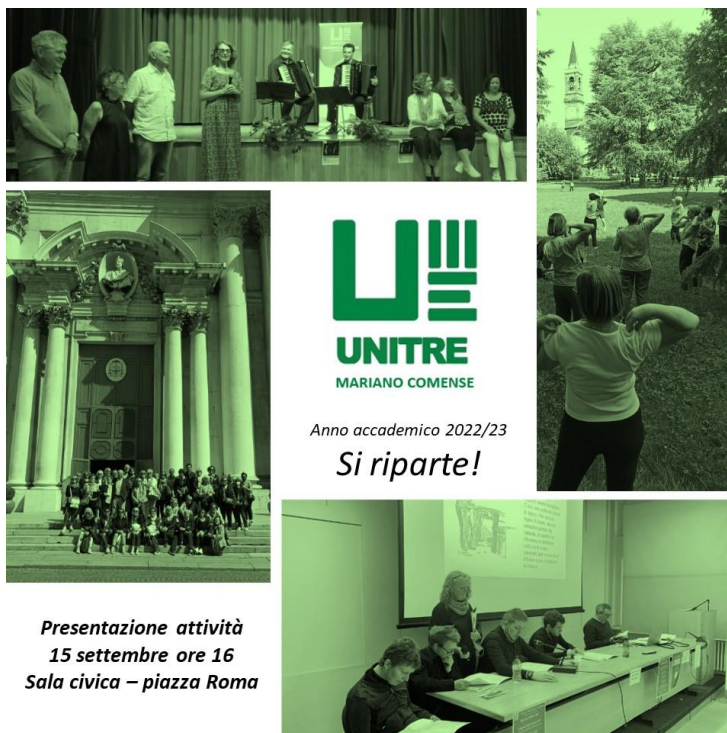
Presentazione attività 15 settembre ore 16 Sala civica – piazza Roma